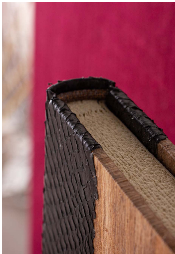
ДЕТАЛЬ: переплёт книги, выполненный мастерами издательства вручную, декорирован египетским папирусом в сочетании с рыбьей кожей

Каждый экземпляр пронумерован и подписан художником и издателем. Экземпляр № 1 предназначен для собрания Государственного Эрмитажа.